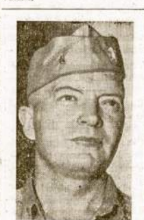
Lt. komandieris Harold Slasen, buvęs Minnesota gubernatorius. Prasišėjęs karui jis rezignavo gubernatoryste ir savanoriai stoji į karinį laivyną.

Už "Liaudies Balsų" ir šioj šalyj reikia daugiau veikti.