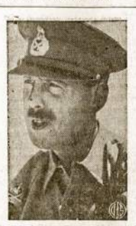
Naujas britų aštuntosios armijos Italijoje komandieris leit. generolas Sir Oliver Leese. Jis paėmė vietą gen. Montgomery, kai pastarasis paskirtas prie generalo Eisenhower vadovaujant invazijai vakarinėje Europoje.