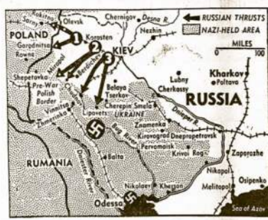
Rytų fronto žemėlapis, kur šiom dienom raudonarmiečiai baigia trauktis apie 10 divizionų načių karionomenės. Iš čia jau nepertoliara ir iki Rumanijos, kur načiai ikišio! gauna didelę nuosimtį taip labai karui reikalingo žibalo.

"Gerb. 'V.' Adm.: LDS 40 ta kuopa užsisako Vilnies Kalendorių 30 egzempliorių.