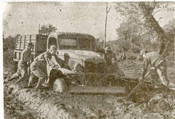
Štai kokiose sąlygose mūsų kareiviam prireikia kariauti Italijos fronte, ai kalnuose šalia sniego audros, tai kloniuose sunkvežiminių ratai klijpsta veik iki pat viršui į dumblą. O visgi ir ten stumiasi pirmyn, nors ir pavaliai.

LONDONAS.—Anglai lakūnai pastebėjo Stavanger, Norvegijos prieplauką, nacių laivų anties pavidale ir nuskandino jį.