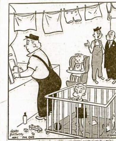
"IT'S THE ONLY WAY WE CAN KEEP OUR HELP—BY LETTING THEM BRING THEIR PROBLEMS HERE!"

Ta juodoji koalicija iš kailio neriasi, atakuodama demokratinę valstybių koaliciją. Ta juodoji koalicija sudaro avanpostą hitlerinės propagandos.