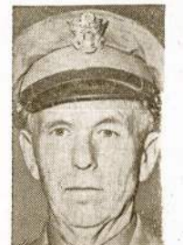
Generolas George C. Marshall, vyriausias mūsų karinio štabo čyfas.