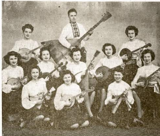
BUDREVIAČIAUS STYGŲ ORKESTRA