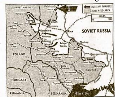
Centrinė ir pietinė rytų kariuo Rytų fronto. Tik šiom dienom raudonarmiečiai pradėjo smarkų ofensyvą Juo-dųjų Jūrų srityje, iš kur arčiausia načių aliejaus šaltiniai Rumanijoje.

Tai gražus atsiliepimas moters amerikietės, kurios vyras mėgsta skaityt "Vilnį".