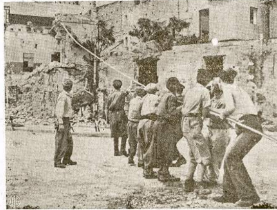
Civiliai italai apvalo griuvėsius Palermo mieste. Bombų ir artilerijos šovinių sugriautų būdinkų kaikiuros sienos tebestovė, bet taip riekiai besilauko, kad gresia didžiausiu pavojum užgrūsti bile valandą. Dėlto, kaip matosi šiame atvaizde, pirmiausia nugriauinama tebestovinti sienos.

Apart kitų svarbių reikalų turėsime nušviesti planus dėl pasekmingo pasiruošimo mūsų parengimui, kuris įvyks vasario 12 d. (šeštadienį) vakare, 15804 St.