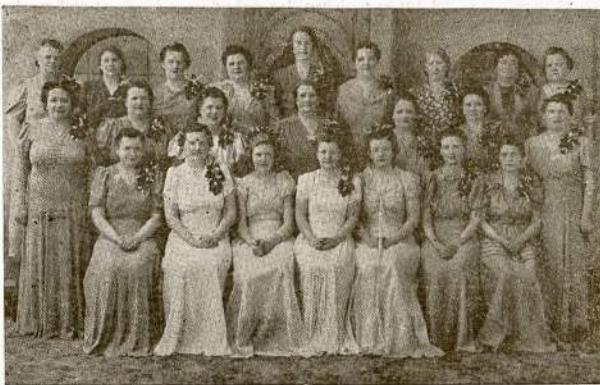
CICERO MOTERŲ CHORAS