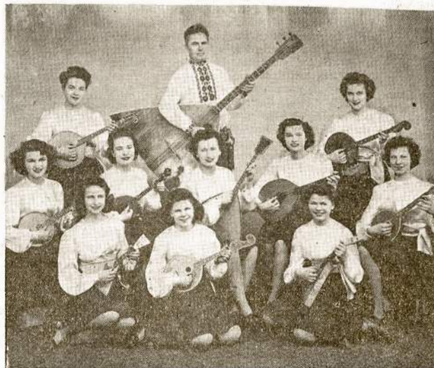
BUDREVIAUS STYGŲ ORKESTRA