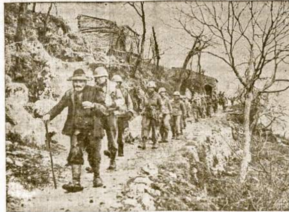
Tipiškas Italijos kaimo kerdzius veda būr amerikiečių kareivių tik jam žinomais šuntakinis. Šie kaimiečiai aktualiai išgelbsti dangelio amerikiečių gyvasis. Jiems žinomi visi takeliai ir suteikiamos informacijos apsaugoti amerikiečius nuo minom apšėtų viešelių ir kelių.

Vokiečiai be pasigailėjimo pleškino į abu kovotojus, kapojančius vielų užtvaras. Jų, rodosi, ir kulkos bijojo. Kai kovotojai pasiekė vielų užtvaras, abu drąsuoliai jau buvo besapiekię prieš apkausus.