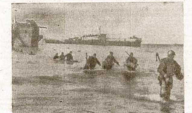
Penktosios armijos daliniai išsiekia į Italijos sausžemį iš Jūros netoli Romos, nacių “Gustav” linijos užnugarje. Ši invazija padaryta taip staigiai, kad naciai pagauti “bemiegan” ir dėlto mūšikiai teturėjo stebėtinai mažai nuostolių.