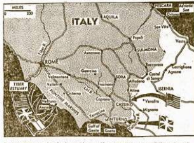
Italijos žemėlapis kur šiom dienom eina karščiausi mūšiai. Aliantų armijoms išsikėlus netoli Romos, naciam gresia pavojus tapti atkirstais prie Cassino ir Minturno srityje.

LONDONAS. — Garsusis apdraudos trustas Lloyd priėmė premjerą Churchillį savo "garbės nariu."