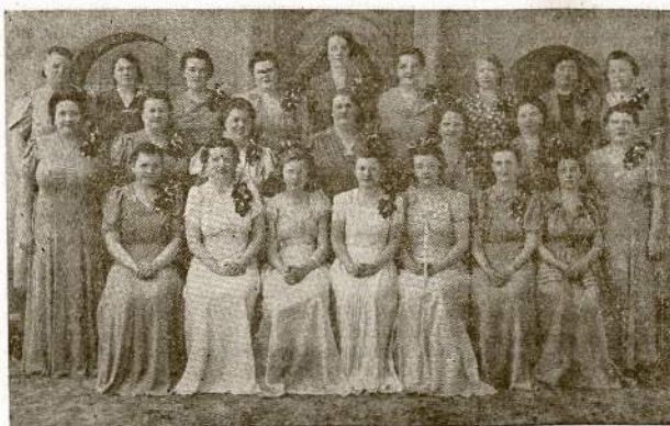
CICERO MOTERŲ CHORAS