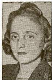
Senatoriaus Truman dukte Mary Margaret, iš Independence, Mo. Ji angtien "pakrikštijo" mūsų didžiausią karą laivą (battleship) "Missouri."