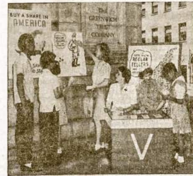
Stamford, Conn., mokyklos vaikai demonstruoja kaip “užtroškinti” Hitlerį investuojant į karo bonus ir stampas.