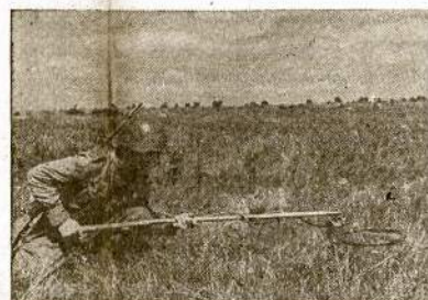
Lietuvius raudonarmietis su magnetiniu prietaisu keliu nacių paslėptų minu, kad atidaryti kovūnams kielą linkui išlaisvinimo Lietuvos.

Abi srovės veiks savistoviai, bet viena kitai nekens, o dar gelbės, sako susitarimas. (Anglijos ir SSSR vyriausybė išsireiškė norą, kad graikų tarp savęs nekariautų.)