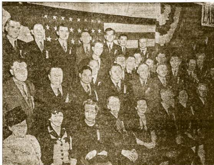
Dalis Demokratinės Amerikos Lietuvių Tarybos narių; nuotrauka padaryta tuojau po Suvažiavimo prieš trumpą pošėdį, kuriame buvo išrinkta valdyba ir nustatyta kai kurių darbų programa.

Vieni juokai buvo klausytis jo tų sveikinimų. Kokią teisę turi jis sveikinti varde Lietuvos žmonių, kuomet jis tų žmonių nematė per eilę metų. Ką jis žino apie Lietuvos žmones kokis anų atsinešimas. Jeigu jie žinotų apie tą fašistų kermošėlį, ir jeigu galėtų, tai reikštų didžiausią pasipiktinimą.