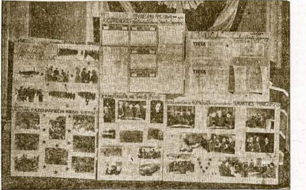
Nuotrauka iš parodos, suruoštos Demokratinų Lietuvių Suvažiavime New Yorke; joje matosi grupės lietuvių kovėnų, poetas Liudas Gira, ir laikrašėliai, kuriuos lietuviškų pulkų Raudonojoj Armiojoj kovėnai skaito.