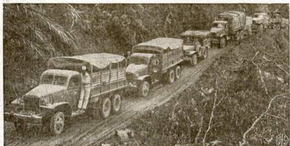
Naujasis Burmos Kelias, kurį Amerikos inžinieriai iškirto per uolinius kalnus. Šiuom keliu jau pristatoma karo reikmenys Kinijai. Trumpoj ateityj kelias būsias praplantinas.