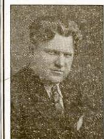
Didžiausia ir Gražiausia Užėiga