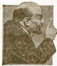
Vladimir Iljic Lenin, Raudonosios Armijos organizatorius ir Sovietinės Valstybės kūrėjas.