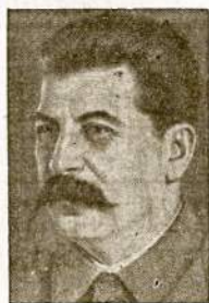
Vyriausiasis Raudonosios Armijos komandierius maršalas Stalinas, Liaudies Komisarų Tarybos Pirmininkas

Lemiamas momentas artinosi. Begalo buvo sunkios apsigynimo dienos Sovietų Sąjungos pionieriams. Šioje