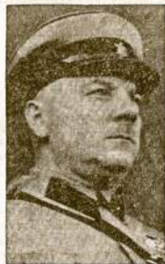
Marš. Vorosilovas, vienas energingųjų Raudonosios Armijos budavotojų. Jo ir Stalino valda baltųjų puolimai prie Caricino. Vėliau tą miestą pavadino Stalingradu, kuris taip garbingai atsilakė 1943 metais kovoje su naciais ir pasuko šio karo mūšius į pergalės užtikrinimą Jungtinės Tautos.

Tais pačiais metais kovo mėnesį Murnmance Anglija išsodina savo armiją. Birželio mėnesį čekoslovakai kartu su baltvardiečiais nuvertė visame Sibire japonų valdžią. Tuojau japonai įsiveržė į Sibirą. Rudeniop į Vladivostoką pribuvo Amerikos ir Kanados ginkluotosios jėgos. 1920 metais Anglija