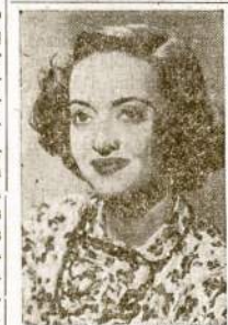
Judžių žvaigždė Bette Davis, kuri šiom dienom veiks visą laiką pavėnečia parduodama Ketvirtosios Karo Paskolos bonusus.