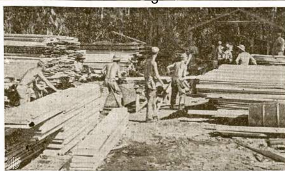
Amerikos armijos inžinierių korpusas įsitaisė lentpiuvę Bougainville saloje, Pacifike. Rąstų ten netrūksta, o statybai medžiagos didžiausias pareikalavimas. Reikia pasibudavoti netik armijai pastatus, bet atremontuoti ir daugelį atvejų naujai išbudavoti daugybę tiltų.