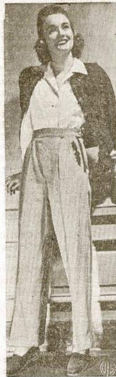
HIKER —This spring hike outfit was featured at a recent fashion show at Waldorf-Astoria, New York. White spun rayon shirt has embroidered pocket. Gray flannel for slacks is green and hand-knitted sweater has silver buttons.

More than 88,000,000 barrels of crude oil were delivered from Texas to the East Coast last year by the "Big Inch" pipeline, Secretary Ickes, petroleum administrator announced.