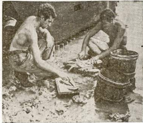
QUICK FISHING —When Marines on South Pacific island desire fish, they have unique way to catch 'em. They use captured Jap ammunition and rifles, firing into shallow water. Concussion stuns fish, Marines gather them, then there's cleaning and—a fish fry!

The baby has been named Darlene Joy. Friend.