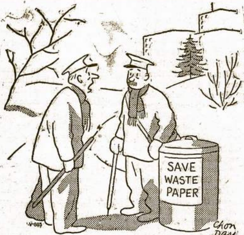
"IT'S TERRIBLE, NOT EVEN A CIGAR BAND TODAY."