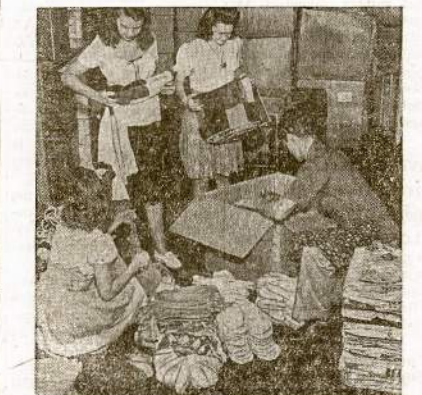
Jaunieji Raudonojo Kryžiaus pagalbininkai ir pagalbininkės. Jie supakuoja siuntinius, kurie išsiunčiami į visus dalis pasaulio, kur tik randasi mūsų kariuomenės daliniai. Šie siuntiniai daugiausia eina mūsų militarinėm ligoninėm.

“Lietuviai jau pačia savo (Tąsa ant 4-to pusl.)