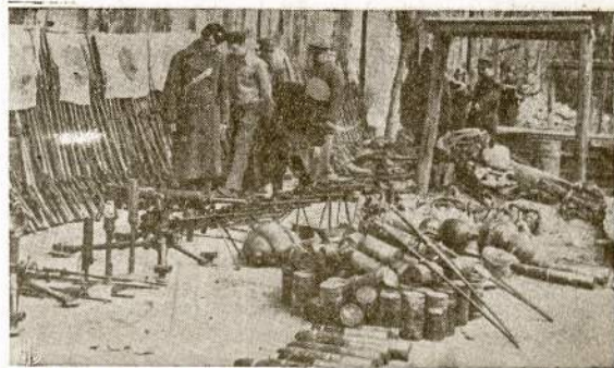
Kiniečiai ir jų talkininkų atstovybė apžiūri karinį laimikį, kurį japonai paliko kai buvo išstrenkti iš Changteh provincijos, Kinijoje. Apart ginklų, amunicijos ir maisto, kiniečiam pateko nemaža japonų pulkininkų vėliavų, kurios čia matomos pakabintos kairėje. Clungteh provincija yra skaitoma kaip ryžių aruodas ir japonai labai veržėsi ją okupuoti, bet tapo atmušti su dideliais nuostoliais.

AMERIKOS Raudonasias Kryžius ir Tarptautinis Raud. Kryžius pagedbėjo net 35,000,000 vjū, moterų ir vaikų iš 39 skirtingų šalių. Remkite šį darbą! Ankokite į 1944 m. Raudonojo Kryžiaus Karo Fondą.