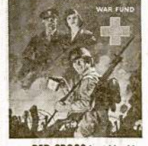
Your RED CROSS is at his side

Virs 1,500 Dalyvavo Bankiete Vajaus Atidarymui