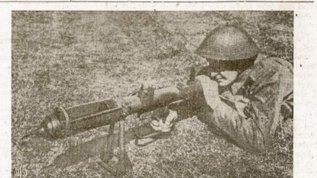
Britų kareivis taiko su antitankine kamuole, vadinama "Piat." Mūsų armijoje panaši kamuolė užvardinta "Bazooka." Kamuolė šauja 3 svarbių bombol ir išvyto tokių pajėgų, jog pralaužia 4 colij storio plienines tankų sienas. Kamuolė sveria tik 33 svarius ir lengvai gali būti pernešama vieno kareivio.