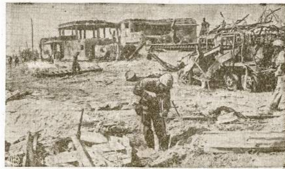
Kvajaicin atoll'je liko tik griuvėsiai iš japonų išvirtinimų. Čia matosi mūsų kareiviai apvalo griuvėsius ir įrengia savas bazes, kad iš jų galėtų bombarduoti naujas japonų pozicijas.

Ex-Kareivis. Japonai Pradėjo Atakas Burdoj NEW DELHI. — Kalėdan slėny, arti Kyauktaw, 46 mylias nuo Akvabo, japonai pradėjo kontratakus prieš anglus. Anglai čia gerokai buvo pirmyn nužygiavę.