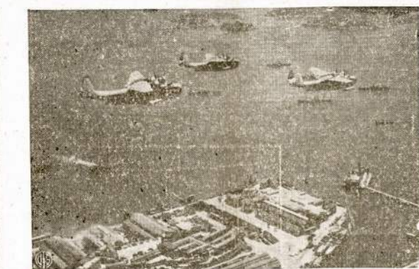
Jungtinių Tautų laivų konvojus išplaukia iš Rio de Janeiro, Brazilijos, lydintis mūsų orlaivų. Orlaiviai yra dalin mūsų karinio laivyno ir jų pareiga yra apsaugoti laivus su karo reikmenimis iki jie pasiekia tikslą.

Koncertinis programą prasidės nuo 2 val. po pietų, bus ir įdomių kalbų. O nuo