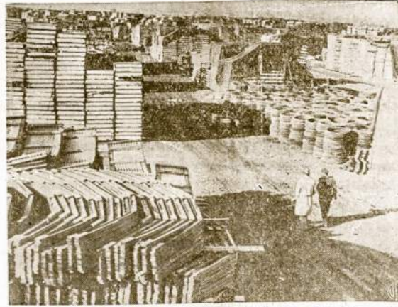
Kiek tik akis gali pasiekti laukas nuklotas gatavai "sukirpta" medžiaga išbudavojimini mūsų armijai barakų Anglijoje. Šitie barakai tuom parankūs, kad mažiausiom pastangom gali būti suardyti ir perkelti iš vienos vietos kiton.