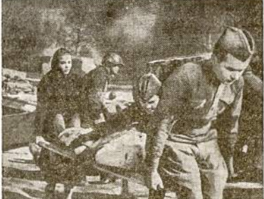
Vaidzas iš sovietinės filmos "Nėra Didesnės Mėlės." Ši Filma, kuri New Yorke turėjo puikiausią pasekimą, yra rodoma World Playhouse teatre, 410 S. Michigan.