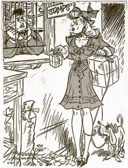
"NO, LADY, CAN'T HELP HOW SMALL THE PACKAGE IS— V-MAIL IS JUST FOR LETTERS!"

course of forced labor in Germany; when an exact account is given of what the German military and Gestapo authorities did in our country with political prisoners, their families, their wives and children, of what they did with those whom they believed to be in contact with us abroad, and from whom they decided to force confessions of treachery to their own friends by torture; when our future writers describe the moral sufferings of a nation of millions in which every single individual has suffered with blood and tears the humiliation, the degradation, the moral and physical bestiality of the German domination, then will the world realize the nature of German culture since 1933, the nature of German total war and of a Germany which wished to enthrone nazism, in the words of Hitler, for a thousand years . . . no decent person can nowadays believe that the majority of the German people are still human beings. This is a terrible fact, but it is true all the same. The whole of our people must demand at the moment of victory that all this must not be forgotten and must not remain unpunished; and the whole world should swear that this shall not remain either forgotten or unpunished."