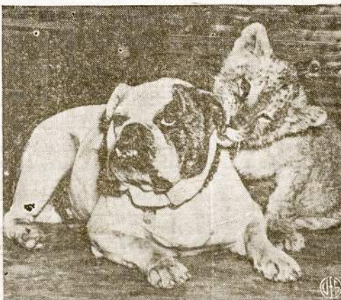
WATCH IT, JOEY! — Lady, four-months-old lioness who's mascot at Fort Worth, Texas, Army Air Field, goes to work on ear of Beautiful Joey, English bulldog, also a mascot. As you may see, Joey really doesn't want to fight, but Lady's going too far—yessir, just too far!