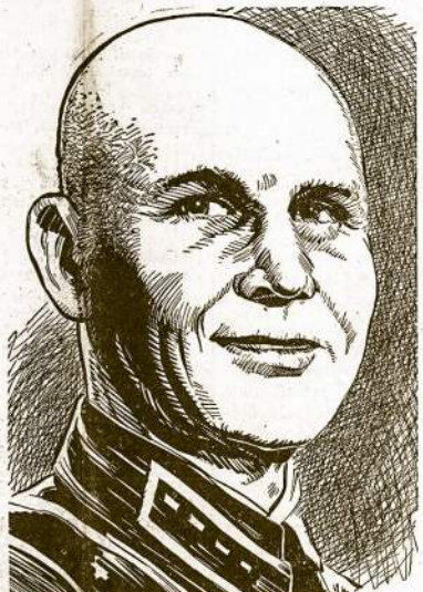
Marsalas Ivan Konev, vienas iš žymiausių Raudonosios Armijos vadų. Jo pulkai pirmieji įžengė Rumunijos teritorijon. "Vilnyje" greit t'aps jo gyvenimo aprašymas.