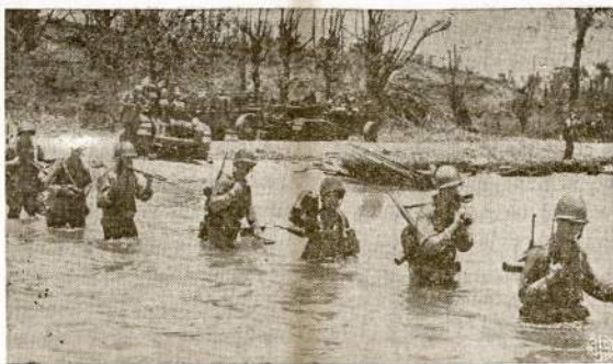
Būrys mūsų artileristų išsiekia Maunus saloje, Admiralty salyne. Nesant priedauro, laivai negali prisirtinti prie kranto. Dėlto karčiai turi netik patys bristi iki sausžemio, bet nešė nėstis visą karinę įrangą, kad bile minutį galėtų puliti prieš.

Mūsų broliai ir sesutės, maži ir seneliai, kurie dar gyvi liķe Lietuvoj, su nuvytusiais veidais, su ašaru pa-