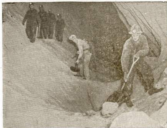
Bene didžiausias druskos sluoksnis svietė raudasi Kanadoje, netoli Malagash, Nova Scotia provincijoje. Sluoksnis tęsiasi per 100 mylių ir druska beveik 100 nuosimčių šviri. Mokslininkai apskaitliuoja, kad šis druskos sluoksnis yra susiformavęs nemažiau kaip 27,000,000 metų atgal. Taigi, virš 26 milijonų metų pirma pasaulio "suvėrimo."

Neužilgo jūs nusileisite gal La Guardia airport, ties New Yorku. Pirmiausiai pa- žvelgsite į bokštą, kuriame