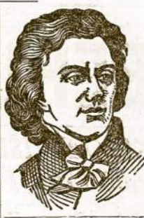
Tai buvo audra politinėse sutemose.