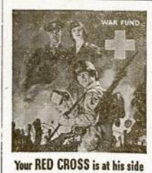
Your RED CROSS is at his side

Iėjus madon Victory Dar- žams, pradėta daryti bandy- mai kaip pagerinti dirvą. Surasta, kad moltojų dirvoj gera vartoti kietųjų anglių pelenus. Pelenai neleidžia molui sukietėti ir šlapumo suteikia dirva nėra taip gli. Ni- kaip traša šie pelenai neturi jokios vertės. Ir tik kietųjų anglių (antracito) pelenai tepatartina vartoti.