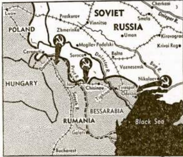
Raudonoji Armija jau priešė teritorijoje. Kai raudonarmiečiai perėjo Prut upę, tai pirmu kartu šiame kare Sovietų armija atsirado priešė teritorijoje, Rumunijoje. Šiuo metu Rumunijon jeita jau virš 60 mylių ir paimta virš 200 apgyventų kaimų ir miestelių. Didmiesis lasi raudonarmiečių apsuptas iš trijų šonų.