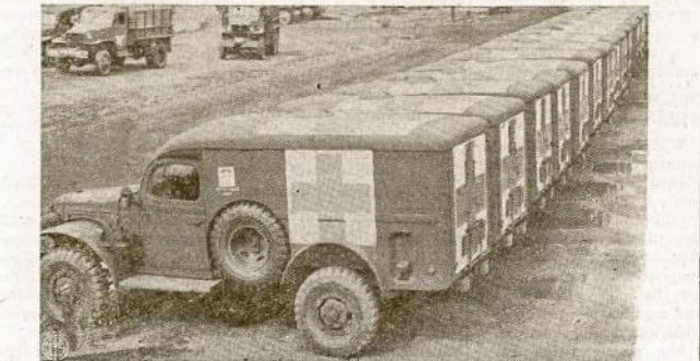
Kurnors Anglijos pajūryje sustatyta cilė Amerikos Raudonojo Kryžiaus ambulansų. Jie gatavai paruošti naudojimui kai prasidės invazija Hitlerio okupuotoje Europoje.

Lietuva jau treti metai niokojama vokiškių okupuota ir juo jie tenai ilgiau siautės, juo daugiau žalos pridarys. Ne vienas esame matę išlaisvintų rajonų niūrius vaizdus, ne kitoki gal tėti pamatyti ir savo krašte. Reikės daug vargo ir darbo pakelti, reikės daug turto jėti, kol atstatysime nualinatą tėvynę. Tačiau Tarybų Sąjungos vyriausybės ir partijos nužymėtos priemonės jau išlaisvintų rajonų ūkiai atstatyti ir mums teikia daug vilčių. Mes galime būti tikri, kad savo krašte atstatymo darbe nebusime pamiršti ir palikti vieni, o atvirščėiai, mus rems visos Tarybų Sąjungos tautos.