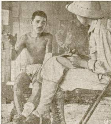
Kokis skirtumas elgėsi juo karo bėlaivais. Kada japonai nušūstis visąj kankina, tai mūšiškaai suėmė japonų kareivių kuograziausia apscina su juom. Štai vienas jų sumitas Los Negros saloje, Admiralty salyne. Pirmiausia aprišta jo suzeista koja, apdovanotas cigaretu ir tik paskui apklaušėjamas.

Ir taip žingsnis po žingsnio mūsų kariai eina į vakarus, visur nešdami laisvę ir džiugusnį vokiečių išankintiems tarybinams piliečiams. Su kiekvienu išvadotu kaimu ir miestu mūsų eiliniai didvyriai vis labiau artėja prie savos giminės, prie tat mylimos ir brangios Lietuvos.