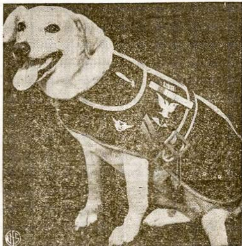
BUSY PUP —Torpedo, mascot of Navy air squadron now at Charleston, S. C., has this record: Sailed in merchantman; was in invasion of Africa; survived sinking; mothered eight pups; has flown more than 300 hours and has rating of aviation machinist's mate, second class. She wears insignia of various services in which she has taken part.

Well, according to Herr Grigaitis, they could not be punished, because they are not really