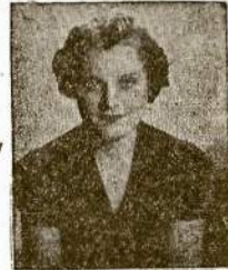
AGOTĖLĖ KENSTAVIČIENĖ Dainuotoja Solo