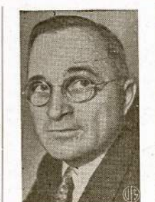
Missouri senatorius Harry S. Truman. Pradėta kalbos, kad jis gali būti demokratų išstatytas kandidatu į vice-prezidentus.

SAN SALVADOR.—Amerikos atstovas vyksta Washingtonan raportuoti savo valdžiai apie padėtį šioj mažoj Centralinės Amerikos respublikoj.