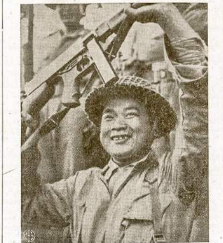
Produktas leit. generolo Stilwell, kinietis kareivis, linksmi mosikuoja kulkovsavižiu po pasekmingo mūšio su japonais Burmoje.

Per visą tėvynės karo laiką tarybiniai geležinkelėdžiai atstatė daugiau kaip 15,000 kilometrų geležinkelių linijų, daugiau kaip 70,000 kilometrų telegrafo ir telefono linijų, daugybę tiltų, stočių ir kitų susisiekimo kelių įrengimų.