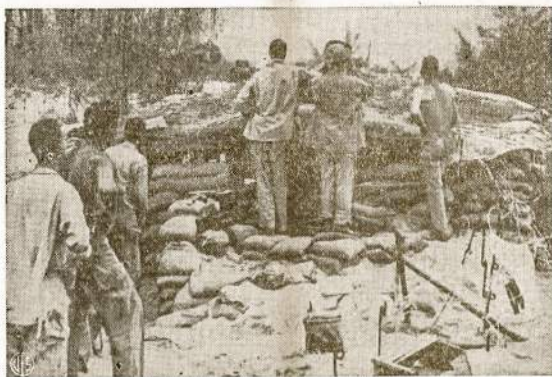
Būrys mūsų pėstininkų lėmija iš už barikadų kaip mūšiški aviatoriai daužo japonų įtvirtinimus Empress Augusta įlankoje, Bougainville saloje. Japonai iš šios vietos jau prasa linii.

Fijii salos yra prie pat ekvatoriaus. Jose yra labai karšta.