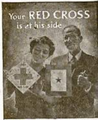
1944 WAR FUND

WASHINGTON.—CIO unij viršininkai griežtai pasisakė už palaikymą kainų kontrolės.