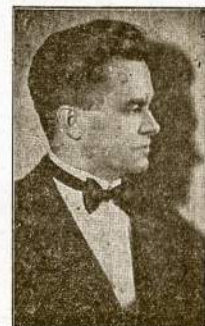
POV. DAUDERIS Dainuoto solo