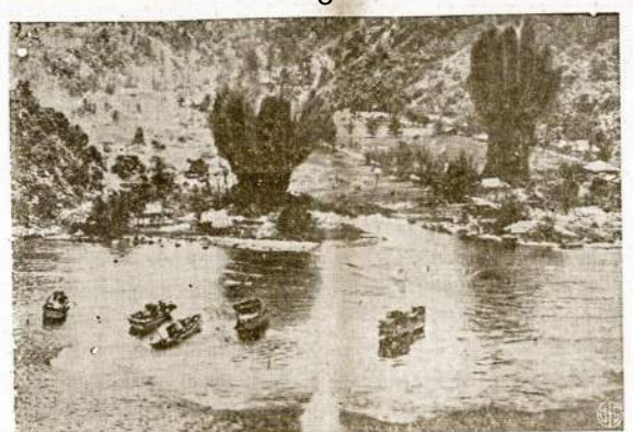
Jankiai bombarduoja japonų lažę olandų Naujojojo Gvinejoj. Netikėtai užkūpti japonai priversti buvo pasitraukti toliaus ir rąstus ir mibisikam atiteko keli airportai ir pati svarbiausia militarinė bazė toj apicinkėj Hollandia.

Nuo savęs linkiu juo skubiausiai susveikyti ir stoti į bendrą visumeninį darbą. J. L.