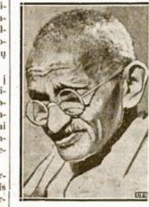
Indijos nacionalistų vadas Gandhi. Jis galvoja apie susitarimą su Indijos Musulmonų Lyga tiksli sudaryti vieną nacionalį frontą Indijoje.