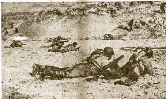
Amerikiečiai kareiviai Anglijoje pratinaš į vazijas. Čia jie kaiti šlipę iš vandens ant kranto šliauzia link "priešo" pozicijų. Kiekvieną pora kareivių turi po vieną "bazooką," tai šautuvas, kuris šauja raketinius sviedinius. Naciam šis mūsų ginklas, sako, nelabai patinkaš.

Panašiai įvyko Graikijoj. Čia vokiečiai dėjo stipriausias pastangas, po Lenkija, sunaikinti žydus. Geriausia organizuotas požeminis ir pasipriešinimo