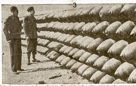
Kiek akys užmato—krūvos plieninių "kiaušinių." Tai mūsų orinių bombų rezervars kur nors Anglijoje. Nors dešimtimis tūkstančių tonų šių "kiaušinių" išdebiama ant nacių militarinių bazių, bet rezervars tuč-tuojaus atpldomas.