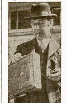
Anglijos izdo ministeris (Chancellor of the Exchequer) Sir John Anderson atsargai nešasi portfelį, kuriame turi planus valstybės biudžeto sekamiems metams.