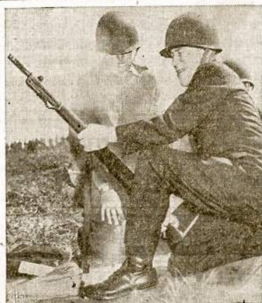
Karo sekretoriaus pavaduotojas Robert P. Patterson moko šauti specialiu šautuvu, kuriuo tolį ir priešo pozicijas numetama granata. Paveikslas nutrauktas kai Mr. Patterson neseniai lankėsi Fort Leonard Wood militarijoje stovykloje.

Karo bonus pirke sustosime tik galutinai laimėję karą. Investuokite kiekvieną atliekamą dolerį į Karo Paskolos Bonus!