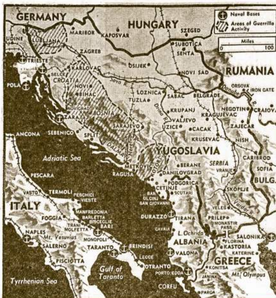
Adrijatiko jūros sritis, Jugoslavija, Graikija ir Italija. Apsidirbę su naciais Italijoje, Aliantai galės daug daugiau pagelbioti Jugoslavijos ir Graikijos partizanams, kurie ir taip jau nemaža nacių nudaugojo.