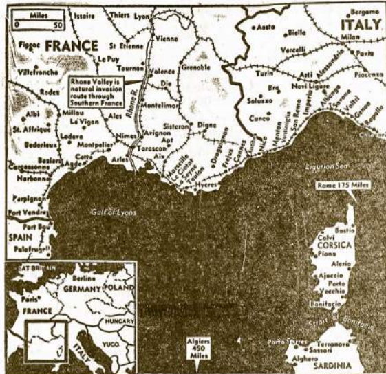
Pietinė dalis Francijios, kur taip jau gali įvykti invazija kaip ir šiaurij srityje. Naciai nežino kurioj vietoj Alantai darys invaziją į ju "europinį tvirtovę", dėlto turi laikyti sumobilizavę didelės jėgas nuo šiaurės jūros iki Balkanų pusiasalio.