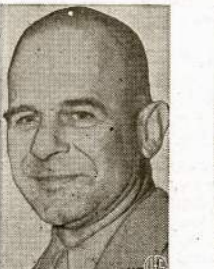
Trys Aliantų komandieriai, kurie gatavai pasirušė vadovauti invazijai Europos kontinentas. Skaitant iš kairės jie yra: leit. gen. Omar Bradley, amerikiečių armijos komandieras; gen. Sir Bernard L. Montgomery, britų armijos komandieras; ir leit. gen. James Doolittle, komandieras amerikiečių aviacijos. Visi jie yra pu vyriausia komanda generolo Dwight D. Eisenhower.