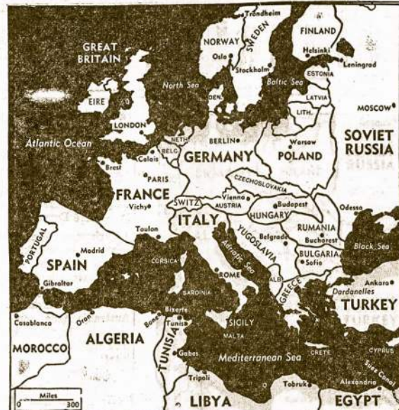
Europos kontinentas ir Viduržemio jūros Afrikos s.r.š. Daugelyje šių vietų dabar eina karas, bet tikimasi neuzilgo pastumti karo frontų arčiau ašies centro, nacių Vokietijos.