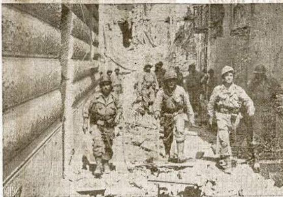
Čia Italų miestas Castelforte, o dabar tik griuvėsiai ir kur-nekur vienišai aprūkęsi siena. Atvaizde matosi būrys francūzių kareivių, kurie rankioja griuvėsiuose pasilikusius vokiečių snaperius.