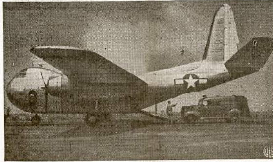
Naujas nerūdijancio plieno prekinis orlaivis, kurio darbas gaminama dideli kiekiai. Orlaivis gali nešti virš 10,000 svarų kroviniu. Čia matosi ir orlaivio "vidurius" įvažiuojantis li-gonvežimis greitam perkėlimui kur jis labai reikalingas.

Nėra abejonės, kad jis aiškiai išdėstys kokios pakaitos padaryta komunistų