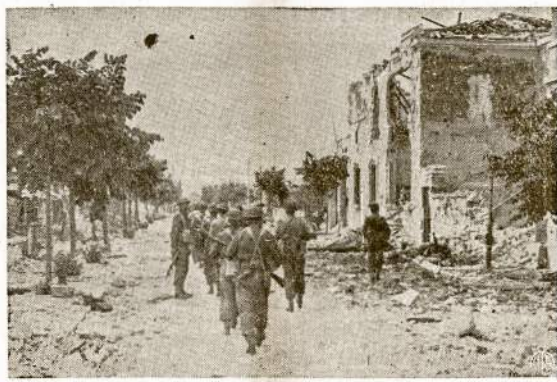
Ameriečiai ir britai kareiviai įmaršuoja į Littoria, Italijoje. Neuzilgo po to naciai ir iš Romos išvyti. Littor'a naciai spėjo veik visiškai sunaikinti. Romoje tačiau nuostolių mažai padarė, apart to, kad apvogė gyventojus.

1939 metais visos mūsų šalies įėjgos buvo $70,800,- 000,000, o 1943 metais jau