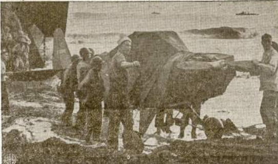
Amerikiečiai iškrauja mažiąją žvalgybinį orlaivį iš laivo kurnors Naujojoj Gvinejoj. Šie orlaiviai labai greitai ir maži. Jie apžvalgo priešų pozicijas ir praneša per radiją mūsų šaukimais.