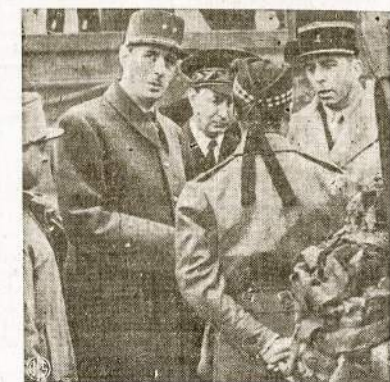
Tautinio Prancūzijos Išlaisvinimo vadas gen. Charles de Gaulle (viduryje) po ketverių metų pirmu kartu atsistojęs savo tėvynės žemėje. Fotografija nutraukta kai gen. de Gaulle anądien atsilankė išlaisvintoje Normandijos dalyje. Su juo matosi anglas karininkas ir kiti prancūzai.