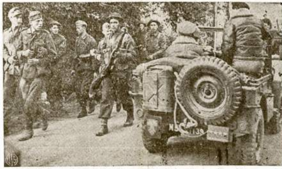
Jauni vokiečių kariai, kurie kelios dienos atgal svajojo apie pasaulio valdymą, manė esą v. ršeni žmonės, dabar mizernai eina nelaisvėn suimti Francūzijoje ir austę žūri į gen. Montgomery važiuojantį toliau Francūzijos. Pastebėsite, kad nacių kariai yra visai jauni, puberniai.