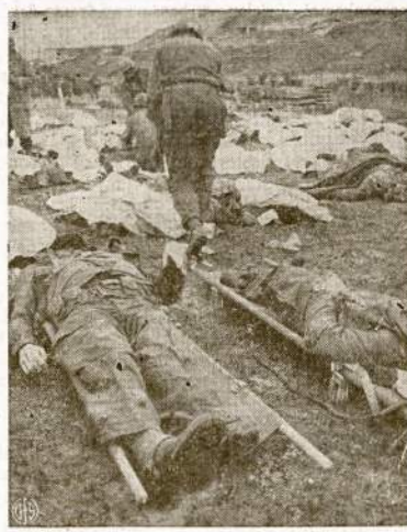
Normandijos pajūris, Francūzijoje, kai iš ten išrenkti naciai. Amerikiečiai ir anglai surenka užmuštųjų lavonus ir sutvarko jų apžeminimo žymes. Užmuštųjų tarpe yra ir amerikiečių.