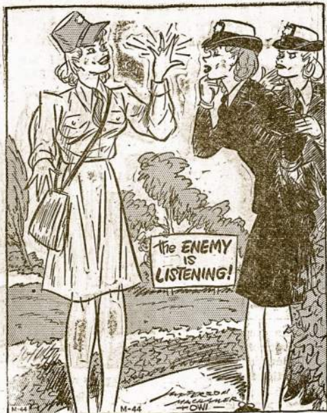
"It's a naval engagement—but I guess I can talk about it."

Wedding bells ring for more couples than ever before in our country, the Census Bureau revealed from a survey of 30,000 homes in 42 states and the District of Columbia. There were 32,000,000 married women in February, exclusive of those in the armed forces, 63 percent of the civilian females. In 1940, the percentage was 60. Among men, it's higher, with 72 percent of the male population married.