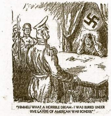
"THINK! WHAT A HORRIBLE DREAM - I WAS BURIED UNDER FIVE LAYERS OF AMERICAN WAR BONDS!"