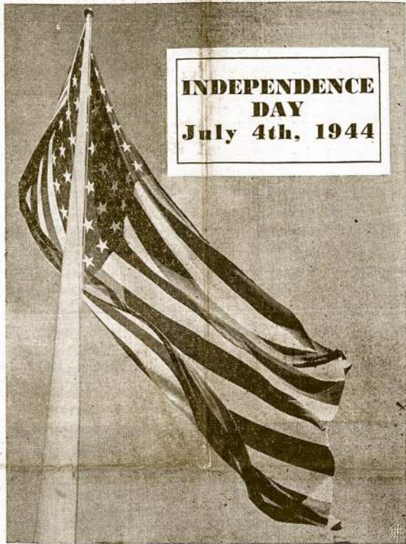
Rytoj Didžioji Tautos Šventė Liepos 4-toji

Penktosios paskolos vėjus laigsis už savaitės. Subruskime. V. Andrusis.