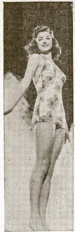
SWIM GIRL — Esther Williams, movie star and swim champion, selected for National Swim for Health Week girl, June 26-July 1. She wears one-piece, half-skirt, form-fitting swim suit. Of crinkly cotton-rayon floral design, it has built-in uplift bra.

With such organizations as this backing the boys, they won't have to worry about being forgotten by the folks back home.