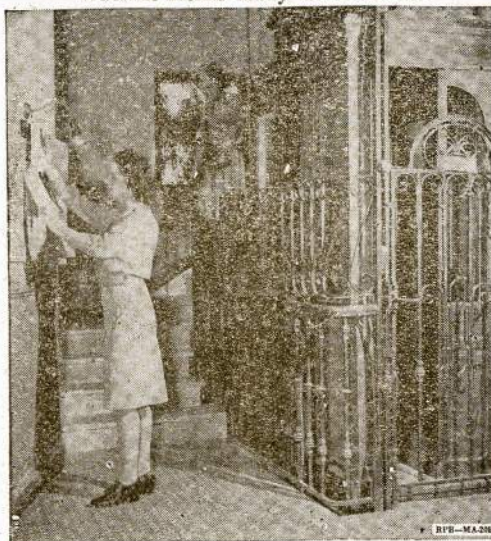
Entrance hall of the apartment house-like barracks of members of the Women's Army Corps serving at Allied Force Headquarters in North Africa. Note the typical French elevator at the right.