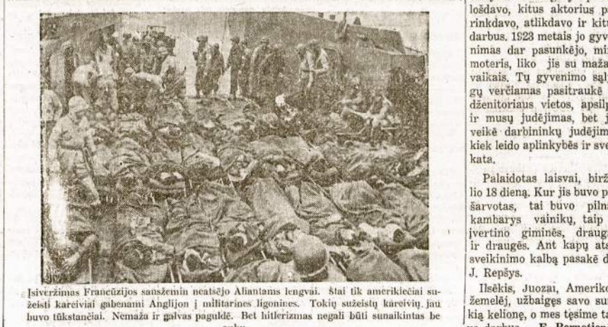
Įsiveržimas Francūzijos sanžemėn neatšėjo Aliantams lengvai. Štai tik amerikiečiai sužeisti kareiviai gubunami Anglijon; militariškas ligonines. Tokių sužeistų kareivių jau buvo tukstančiai. Nemažai ir galvas paguldė. Bet hitlerizmas negali būti sunaikintas be aukų.