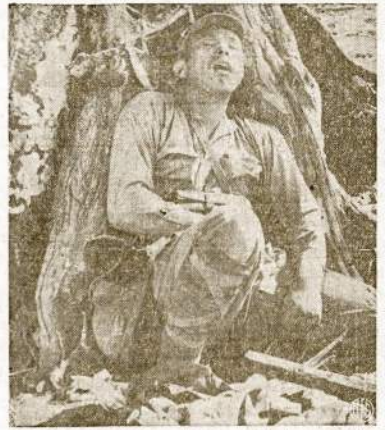
Šis japonas kareivis daugiau jau nebekariaus už "dieviškąjį" savo imperatorių. Jį amžinai užmigdė taiklūs amerikiečiai ranka Saipau saloje, Pacifike. Kolei kas, japonai nenoriai pasiduoda suimami nelaisvėn; didžiūma jų kariauja iki paskutiniam, o nebegeleždami atsilaikyti laudo nusizudyti.