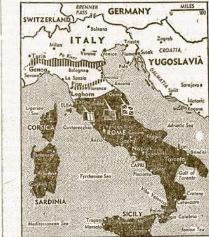
Nors pavaliai, bet Aliantų jėgos stumiasi vis toliau ir toliau į šiaurę Italoje. Siuomi laik amerikiečiai jau visai arti paties svarbiausio Italijos portu vakariniam pakrastyje Leghorn. Toliau į šiaurę hiterininkai dar turi stiprių nio liniją palei upę Po.