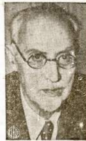
Naujasis Italijos premieras Ivanoe Bonomi. Tas pačias pareigas jis ejo prieš pat fašistų pučą 1921. Pastaruoju laiku jis vadovavo požeimniam priešfašistiniam judėjimui nacų okupuotoj Italijos dalyje.