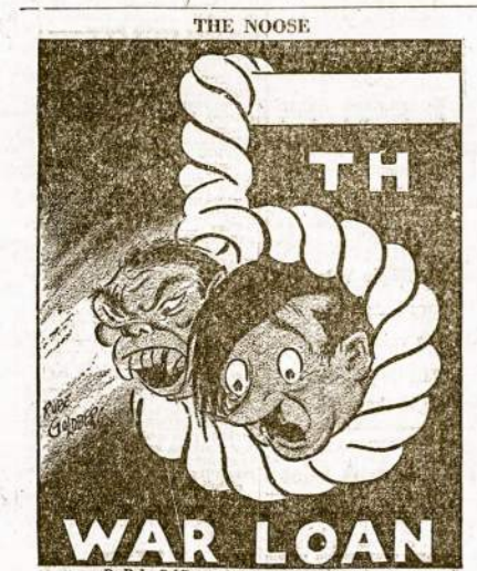
By Rube Goldberg—New York Sun Bell Syndicate

Jūs galite pagarbėti Amerikai sumobilizuoti galinčiausią armiją sumušimui fašizmo reguliariai pasipirkdami J. V. Defense Bondsų ir Stampų.