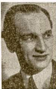
MASKVA.—Justas Paleckis, Tarybinės Lietuvos Aukščiausios Tarybos prezidento pirmininkas, rašo, spauduje apie lietuvių džiaugsmą, įžengus Raudonajai Armijai į Vilnių, senąją Lietuvos sostinę. Jis, tarp kitko, sako: