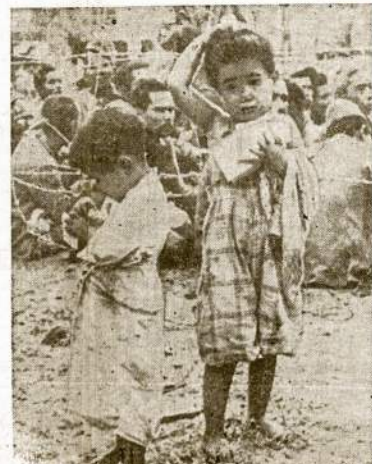
Japonai ant Saipano salos negali atsisitebėti, kad ištrėkė iš ten japonų armiją amerikiečiai netik neskradžia jū, bet duoda saldinį ir kitokių skamskonių. Civiliai japonai mygti buvo labai įbauginti amerikiečiais, nes didžiama jų dar vis slepiasi.

LONDONAS.—Budapešto radžys skelbia, jog įsakta paskribdyti visos darbo unijos, ir kurios buvę prielankios valdžiai.