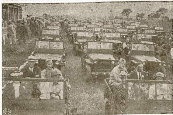
Ivairių valstijų gubernatoriai gauna pasivaikinti armijos "jeep'ais." Tai įvyko neseniai, kada visų valstijų gubernatoriai laikė savo metinę konvenciją Hershey, Pa. Pakenkė rėvę jie apžiūrėjo netoli ekančių armijos stovyklą.

Parodą skaitlingai publika lankė. Apskaučiuojama, jog per visą laiką buvo pažūrėti šios šalies ir priešio karo įrankių 750,000 žmonių.