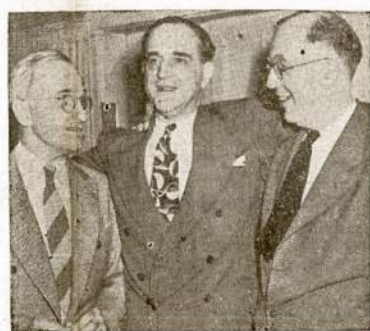
Nominuotas demokratų konvencijoje vice-prezidento urėdū senatorius Harry S. Truman (kairėje) kalbasi su pora kitų konvencijos delegatų, federaliais teisėjais Sherman Minton iš Indianos ir L. B. Schwelplebach iš Washingtono.