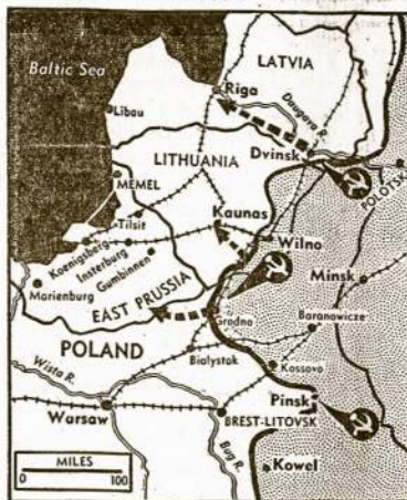
Raudonoji Armija vis tebeina nesulaikomi link Rytų Pransijos. Diktas dalis Lietuvos Tarybinis Respublikos jau išlaisvinta. Neperlotausia jau ir Karaliaučius, Tilžė, Klaipeė.