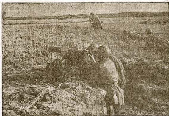
Pirmyn už Tarybų Lietuvą! Po kulkasvaidininkų priedanga lietuviai pėsčinkai atakuoja vokiečių pozicijas.