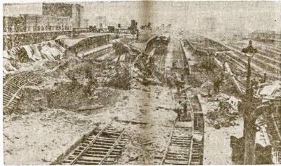
Štai kas liko iš kelželio po Aliantų atakos prie Caen miesto, Francūzijoje. Bėgiai išardyta, kelias išgrautu anglų aviacijos bombardavimu. Išvijus nacius Aliantų inžinieriai tuojau atsteigė kelią.

Konvencijoj aštriai kritikuota S. Dakota republikonai, kurie šią valstiją atstovauja kongrese. Jie yra obstrukcionistai ir kenkėjai.