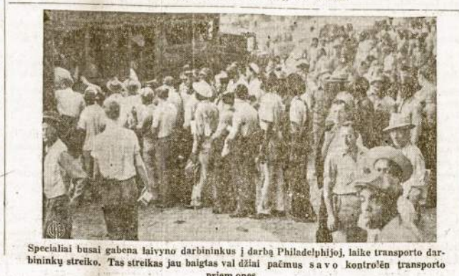
Specialiai busai gabena laivyno darbininkų į darbą Philadelphijoje, laike transporto darbininkų streiko. Tas streikas jau baigtas valdžiai pačmus savo kontroliu transporto priemones.

Atsiprašome visų LDS narių ir abelnai lietuvių. Rengimo Komitetas.