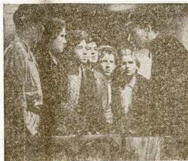
Vaidzas iš sovietinio judžio, kuris šiuo laiku rodomas Worlds Playhouse centre, 410 S. Michigan ave. Judis vaizduoja Ukrainos žmonių kovas prieš vokiečius laike perėjo pasaulinio karo.