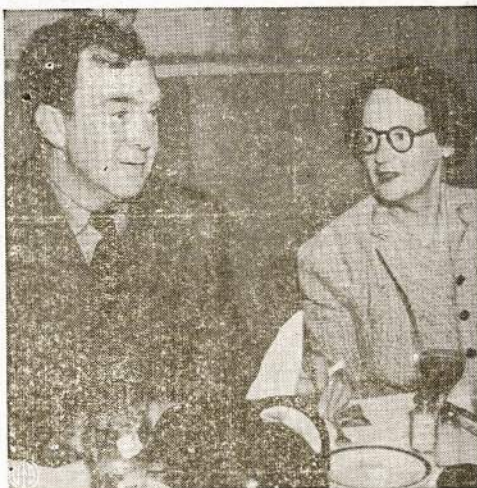
EVENING OUT —Veteran character actor of the films, Thomas Mitchell, is shown in pensive mood as he dines at New York's Stork Club with his wife. They came east for premiere of "Wilson," in which Mr. Mitchell portrays President Wilson's secretary.

America wants your help in the most serious war material crisis of the war! Waste paper is needed on the fighting fronts in the form of shell containers, ration kits, blood plasma boxes.