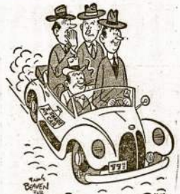
"AMBROSE IS LITERAL-MINDED—HE READ IN THE PAPERS THAT THE CAR SHARING GOAL IS 31 PEOPLE PER CAR!"

a death for him. Even little children now understand that the Fuehrer isn't long for this world. In one way or another he will have to die soon. But a rope will be better: A halter around his neck is the thing for him.