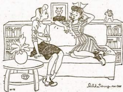
"We're just MADE for each other—I water his Victory Garden and he stakes my tomato plants!"