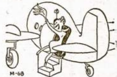
But the best we can wish this Brainless Beaut is a ten mile drop—and no parachute!