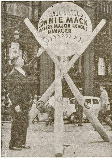
HALF-CENTURY MAN —Baseball world honors 50th anniversary of Connie Mack as major league manager, this year. Above, Chief Bender, one-time A's pitching star, stands beside giant baseball suspended on 10-foot baseball bats, in front of City Hall, Philadelphia, honoring Connie's jubilee.