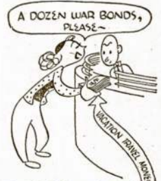
This girl in slacks invests her dough in the finest, truest cause we know

"It is, indade," was the quick reply, "and I wish I knew as little about the matter as he does."