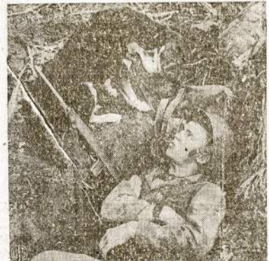
Amerikietis marinas "lapės oloje" ir jo ištikimiausias draugas šuo. Šunys taip gerai išmokinami, jog Pacifiko salų džiunglėse jie yra nepavoduojami "pasiuntiniai." Šis paveikslas nutrauktas Guam saloje, kurią japonai išlaikė okupavę virš dviejus metus.

KLIAUSYKITES MŪSŲ PROGRAMŲ ANTRADIENIŲ VAKARAIŠ NUO 7:30 IŠ STOTIES WGES