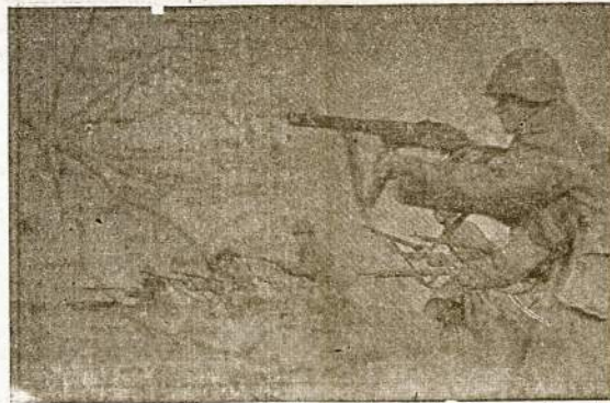
Pirmyn, už laisvą tarybinę Lietuvą!—šaukė lietuviai koviniai, puldami nacių pozicijas Vilniaus srityje.

x Slinko pirmyn bataliniai, ėjo vyrai kaip vienas. Dangus buvo raudonas— įkaitęs plienas. Krito vadas, lyg ažuolas jaunas, Didvyrio krauju sniegą nudažęs. Bet vyrai jau kaunas— Blaškos priešas blindažuos.