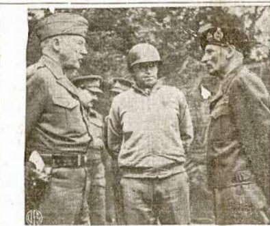
Trys stambieji komandieriai Aliantų jėgų šiaur. Francūzijoje. Skaitant iš kairės yra leit. gen. George S. Patton, leit. gen. Omar N. Bradley ir britų generolas Sir Bernard L. Montgomery. Pastarasis yra vyriausias komandierias visų sausumio jėgų, antras po generolo Eisenhower.

Gromiko užgryė daug punktu Hull'o kalbos. Paskui įdėu širdingai sveikinosi.