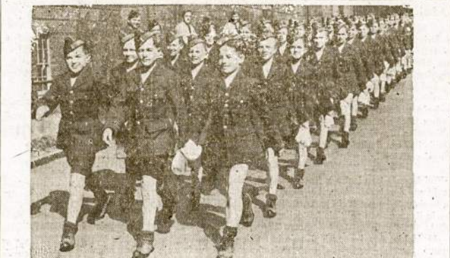
Būsimieji aviatoriai ir aviotorkos. Tai būrys lenkų našlaičių kurnors Anglijoje. Apie 600 jų lavinami ten aviacijos mokyklose ir už kelių metų bus smarkūs lakūnai.

"Tūkstančiai slaugių įsirašė į kariuomenės ir laivyno slaugių korpusą, tas paliko slaugių eilėse spragą namų fronte. Civilijų ligoninės perkimtos ir štabai permaži. Kai kur reikėjo uždaryti daug lovų kambarius, nes diplomuotos slaugės išėjo į karą arba eina svarbias pareigas kitur."