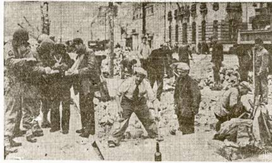
Amerikietis karininkas samdo francūzus darbininkus atremontuoti pačių francūzų miestą Cherbourg. Prispausti prie jūros naciai išdavinatavo prielauką ir ilgai mūsiskitai negalėjo jos naudoti.

Okupacijos metu Grenoble gyvenotai pasižymėjo griežtom kovom prieš okupantus.