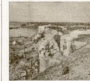
Štai kas belieka iš Hitlerio "Atlanto sienos," kai po ją pramarsuoja Talkininkų armijos. Čia matosi buvusių nacių įsitvirtinimai St. Malo apietinkėje, Francūzijoje. Šiuo laiku jie jau toli užpakalyje.