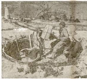
Amerikos aviacijos bazė Baker saloje, Pacifike. Per viš metus lanko mūsų 7-sios aviacijos daliniai veikė prieš japonus iš šios bazės slaptai. Dešinėje matosi jūrų žibintas, amerikiečių pastatytas laike 1812 metų karo.