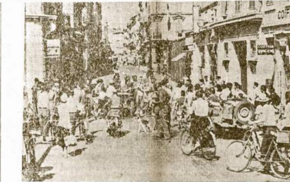
Garsusis francūzų žiemos rezortas Cannes po ketverių metų nacių okupacijos laisviau atsikvepia sulaukęs amerikiečių. Vienatinė francūzų transportacijos priemonė beliko tik dviračiai. Automobilis ir gasolinis naciai senai jau buvo rekvizavę.

Bandymas pravedama Delta Experimental Station, Mississippi valstijoj. Mokslininkai daugiausia