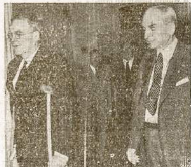
Republikonų prezidentinio kandidato Dewey patarėjas John Foster Dulles (su krukais) ir valstybės sekretorius Cordell Hull. Nors Hull su republikonais bando grąžiai sustarti, bet jie vis nesilaukia kandžioje Roosevelt administraciją.