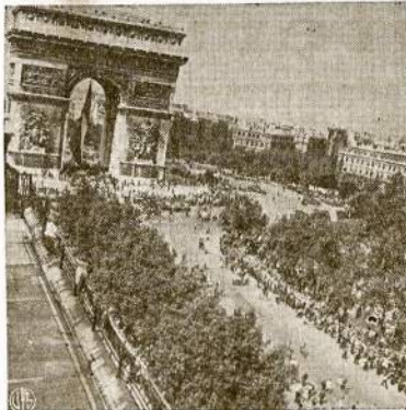
Minios paryžiečių abiem pusėm didžiosios gatvės — Champs Elysees—pasiruošia pergales demonstracijai. Demonstracija tęsiasi ištisus tris dienas kai naciai tapo ištrenkti iš francūzų sostinės.