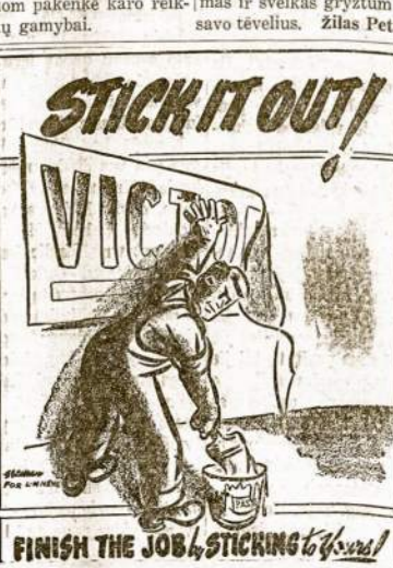
FINISH THE JOB by STICKING to Yours!